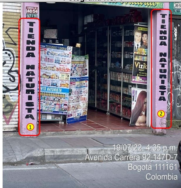
Fotografía No. 4

Elementos de PEV, adicionales al aviso único permitido, ubicados en la fachada del establecimiento de comercio.